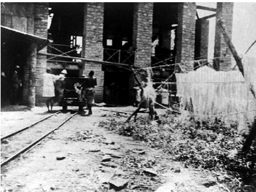
Abb. 7: Besichtigung einer Sisal-Aufbereitungsanlage

Das Hauptinteresse lag auf der Besichtigung von Pflanzungen, Plantagen und wirtschaftlichen Betrieben.