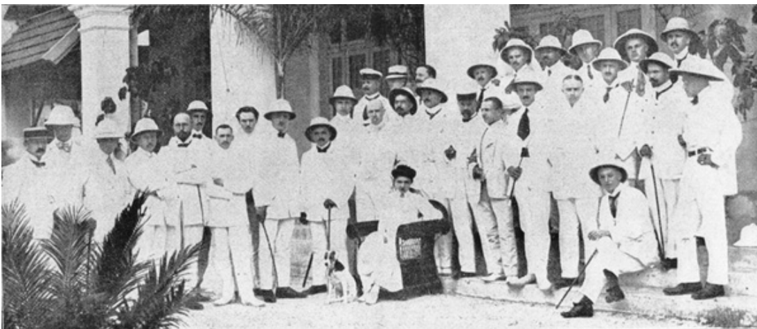
Abb. 3: Die Expeditionsteilnehmer in Dar es Salaam