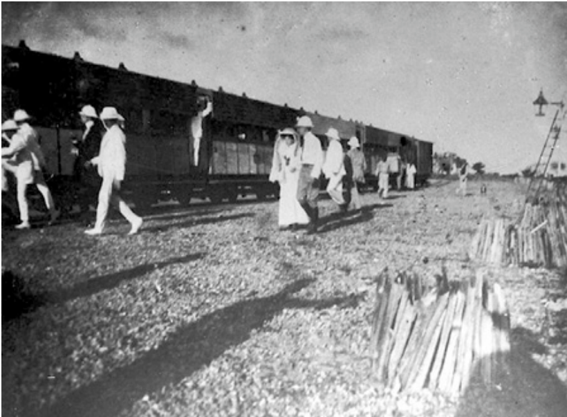
Abb. 4: Halt an einer Bahnstation