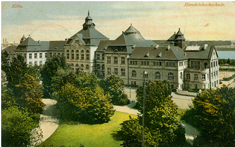
Abb. 2: Die Handelshochschule auf der Claudiusstraße in der Kölner Südstadt

Um die Studenten mit einem ihrer potentiellen Arbeitsfelder – nämlich in den deutschen Kolonien oder im Handel mit denselben – vertraut zu machen, wurde das Vorlesungswesen in die „koloniale Sache“ eingebunden. Pflichtveranstaltungen waren „ Handels- und Kolonialgeschichte “, „ Kolonialpolitik “ und „ Grundzüge des Völkerrechts “ 4 , darüber hinaus wurden jedes Semester weitere Vorlesungen mit kolonialem Bezug angeboten. 5 Meist waren diese Veranstaltungen öffentlich, so dass sich auch interessierte Bürger mit der „kolonialen Sache“ vertraut machen konnten.