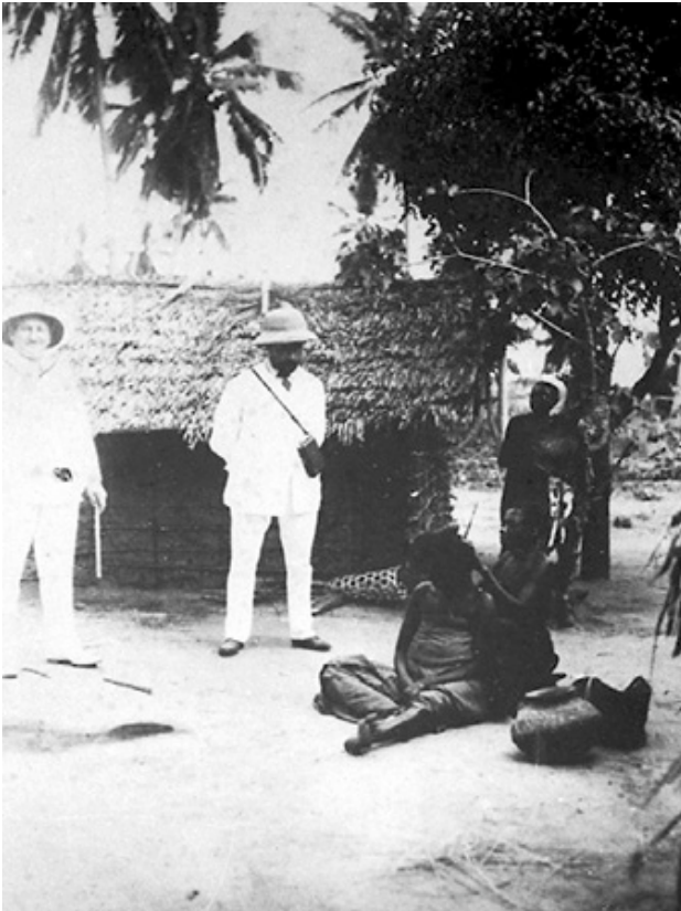
Abb. 8: In den „Eingeborenenvierteln“ kann man häufig – so der Redakteur Müllendorff – „Frauen beobachten, die einander beim Haarputz helfen.“ 29

Hintergründe blieben weitestgehend unverstanden oder wurden, wenn überhaupt, nur für die eigenen Zwecke genutzt.