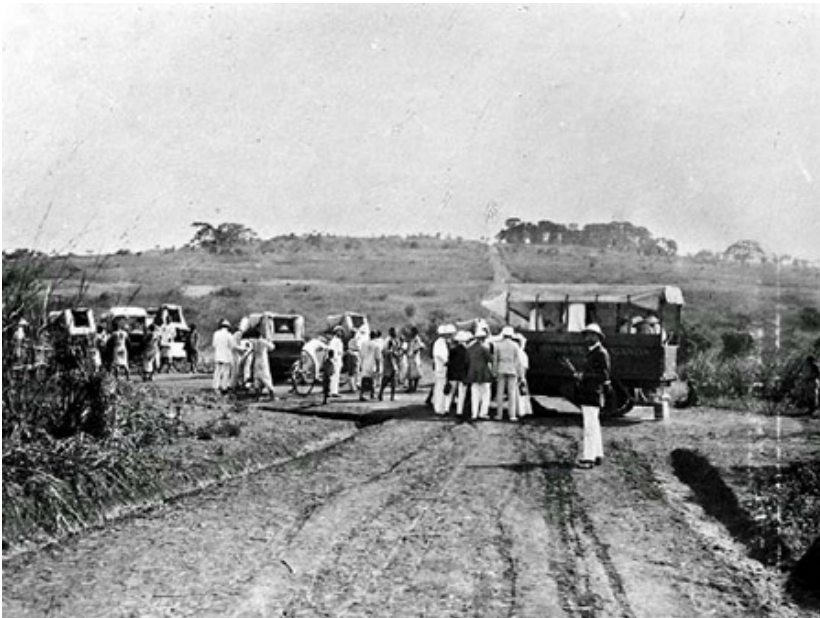
Abb. 5: Die Karawane in Entebbe

Von Neapel ging es mit dem Dampfer Markgraf der Deutschen Ostafrikalinie nach Mombasa und von dort mit der Ugandabahn nach Kisumu zu einer 10-tägigen Rundreise um den Viktoriasee. Von dort ging es dann über Nairobi zurück nach Mombasa, um dann mit dem Regierungsdampfer Kaiser Wilhelm II nach Tanga abzulegen.